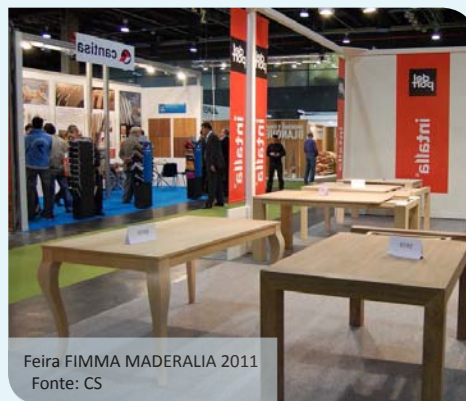
Feira FIMMA MADERALIA 2011

O mercado da União Européia posiciona-se como o maior consumidor e importador de madeira e produtos associados do mundo; posição que também ocupa no mercado do mobiliário.