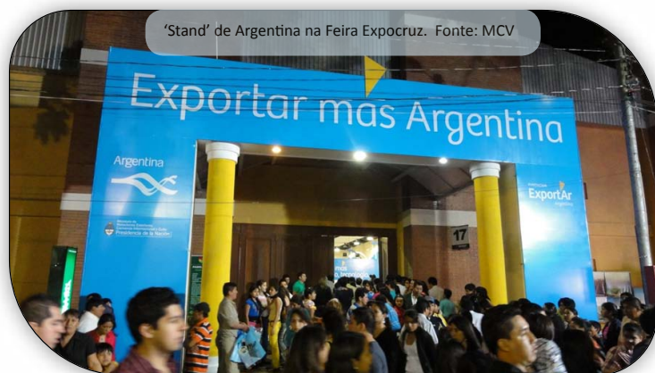
'Stand' de Argentina na Feira Expocruz.

A Feira multisetorial mais importante do panorama internacional, Expocruz, realizada no passado mês de setembro na cidade boliviana de Santa Cruz, contou na edição deste ano com mais de 800 expositores estrangeiros da Alemanha, Argentina, China, Espanha, EUA e Rússia, entre muitos outros.