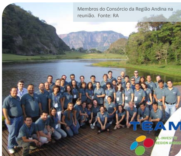
Membros do Consórcio da Região Andina na reunião.

26-28 outubro, Santa Cruz de la Sierra, Bolívia