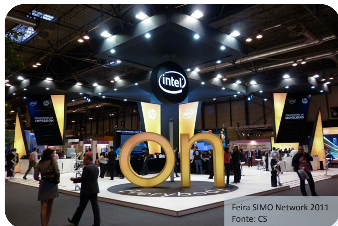
Feira SIMO Network 2011

Contacto: Anabella Cosentino acosentino@cncs.com.uy