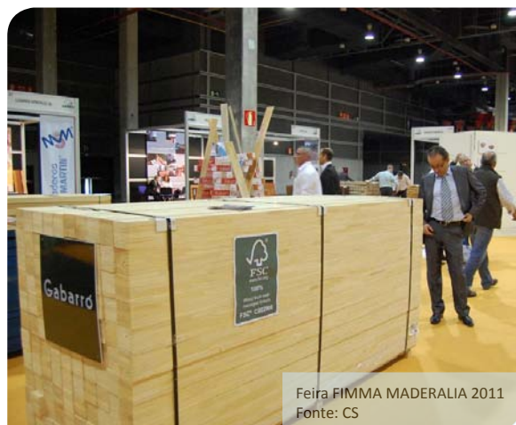
Feira FIMMA MADERALIA 2011

Contato: Diana de Ávila Tordecilla ddeavila@cccartagena.org.co