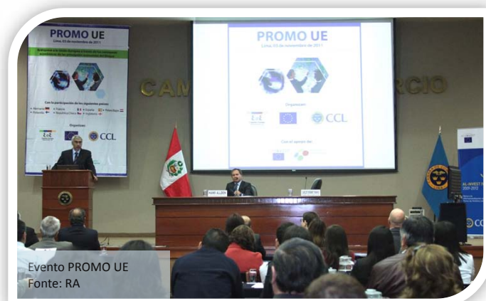
Evento PROMO UE