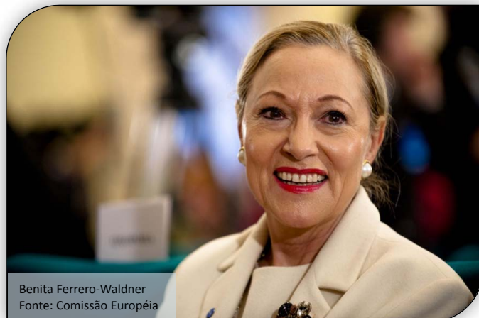
Benita Ferrero-Waldner