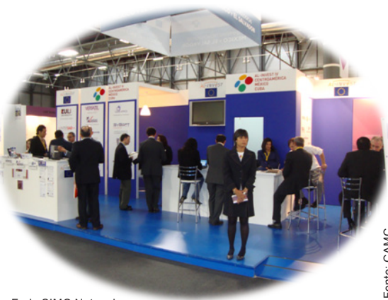
Feria SIMO Network