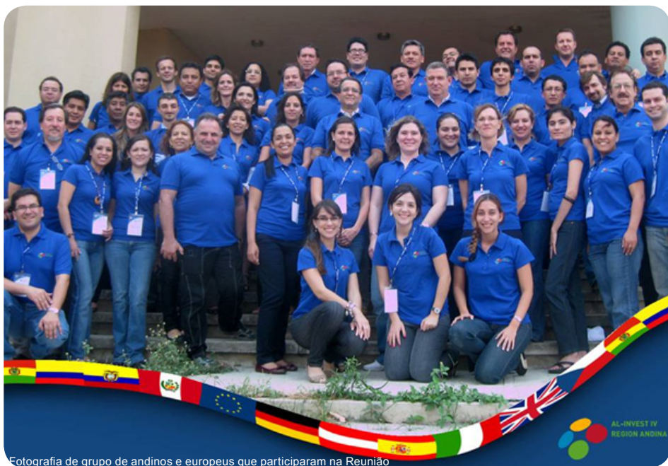
Fotografia de grupo de andinos e europeus que participaram na Reunião