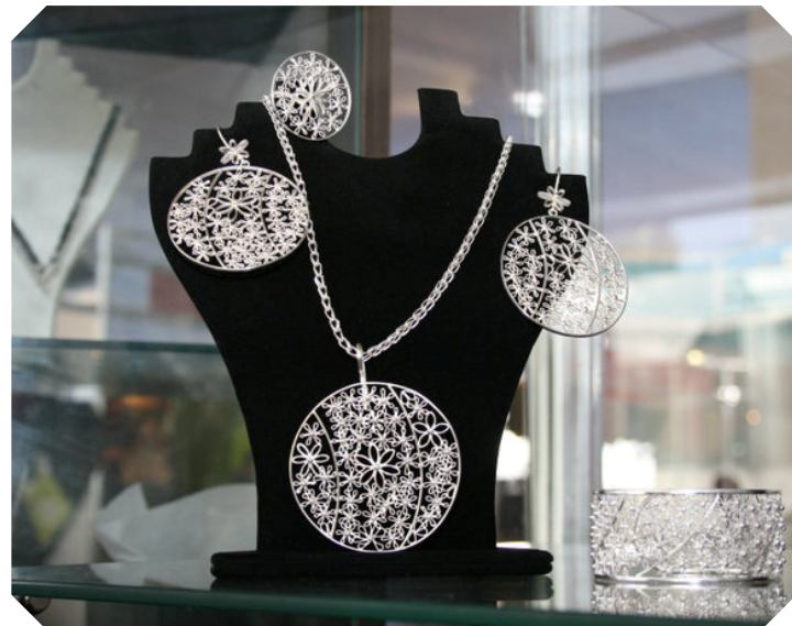
Jóias de prata de Catacaos exibidas na Peru Moda 2010

negociar o preço dos seus produtos com potenciais clientes; e, por último, melhorar a sua apresentação e acesso a mercados através de uma boa imagem corporativa.