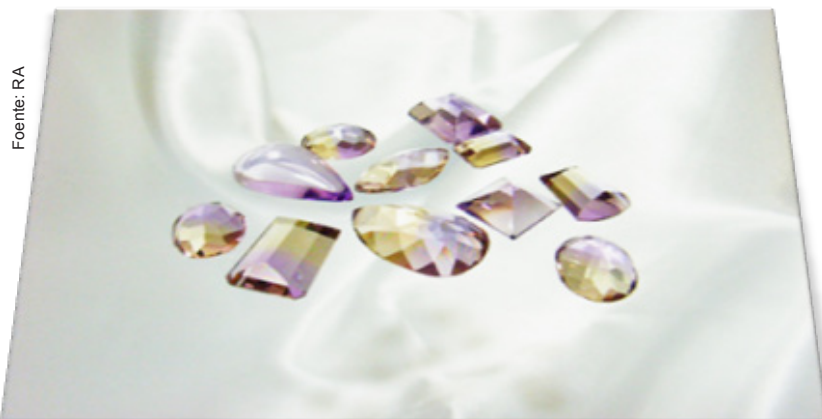
Bolivianita como matéria prima de joalheiros: Pedra preciosa natural que somente pode ser encontrada em Bolívia

Entre as actividades a destacar está a impressão do catálogo do núcleo "Manos Creativas", onde foi exposto o melhor da Joalheria boliviana. A publicação foi distribuída a nível nacional em lugares estratégicos para posicionar este tipo de produtos.